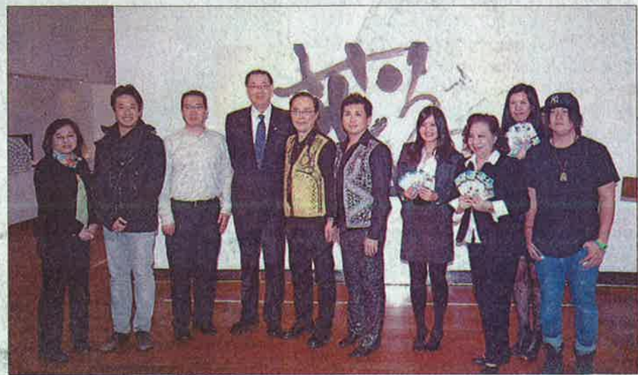
圖：駐紐約台北經文處高振群大使(左四)與福爾摩沙表演藝術協會、「臺灣歌仔嘉年華」的立

由紐約臺僑社團主辦的「喂！臺灣！」搖滾音樂會今年是第二屆，邀請了四個紐約的獨立樂團參與演出。這個音樂會將在11月19日(星期六)晚上七點半至11點於法拉盛臺灣會館舉辦，當天七點入場。主辦單位希望透過「喂！臺灣！」搖滾音樂會，讓臺灣人社區的新生代有更